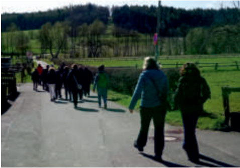
Von Alhausen nach Bad Driburg