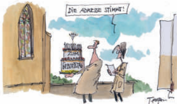
Grafik: Gerhard Mester, „Wer Ohren hat, der höre...!“, edition chrismon

Die Kirche ist vormittags für Besucher geöffnet; ab 12.00 Uhr nur bis zum Gitter. Herzliche Einladung an alle, die ein Gebet sprechen möchten oder eine Kerze anzünden wollen.