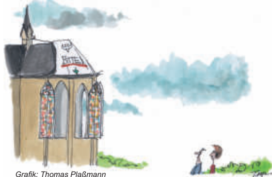
Grafik: Thomas Plaßmann